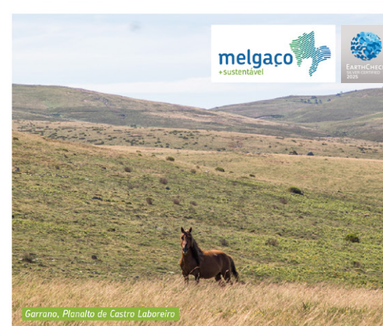
Garrano, Planalto de Castro Laboreiro

Flora: Bolas-de-algodão ( Eriophorum angustifolium ), Orvalhinha ( Drosera rotundifolia ), Erva-Loira-de-Melgaço ( Senecio legionensis )