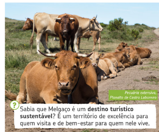
Pecúria extensiva, Planalto de Castro Laboreiro

Sabia que Melgaço é um destino turístico sustentável? É um território de excelência para quem visita e de bem-estar para quem nele vive.