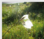
Bolas de algodão

Flora: Bolas-de-algodão ( Eriophorum angustifolium ), Orvalhinha ( Drosera rotundifolia ), Erva-Loira-de-Melgaço ( Senecio legionensis )