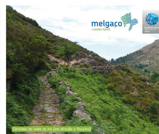
Caminho da volta do rio (em direção a Pousios)

Flora: Tormentelo ( Thymus caespitius ), Carqueja ( Pterospartum tridentatum ), Açucena-portuguesa ( Paradisea lusitanica )