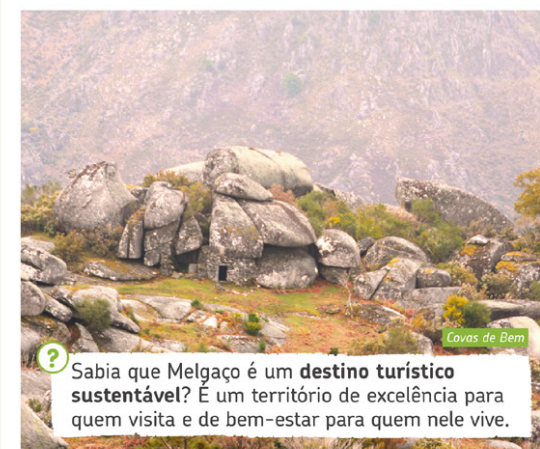
Covas de Bem

! Sabia que Melgaço é um destino turístico sustentável? É um território de excelência para quem visita e de bem-estar para quem nele vive.