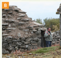
CURRAIS DO CURRO DA VELHA Branda de gado conhecida por Curro da Velha. Local de grande beleza paisagística. Zona de transição entre Castro Laboreiro e a Peneda (Arcos de Valdevez).