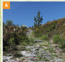
ANTIGA CALÇADA Calçada composta por lajes de granito, assentes de forma rudimentar, cuja construção se perde no tempo.