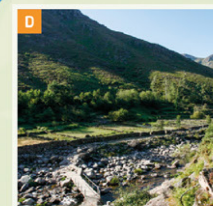
RIO LABOREIRO Nasce no planalto de Castro Laboreiro, atravessa todo o seu território e, no seu troço final, de cerca de 14 Km, marca a fronteira entre Portugal e Espanha.